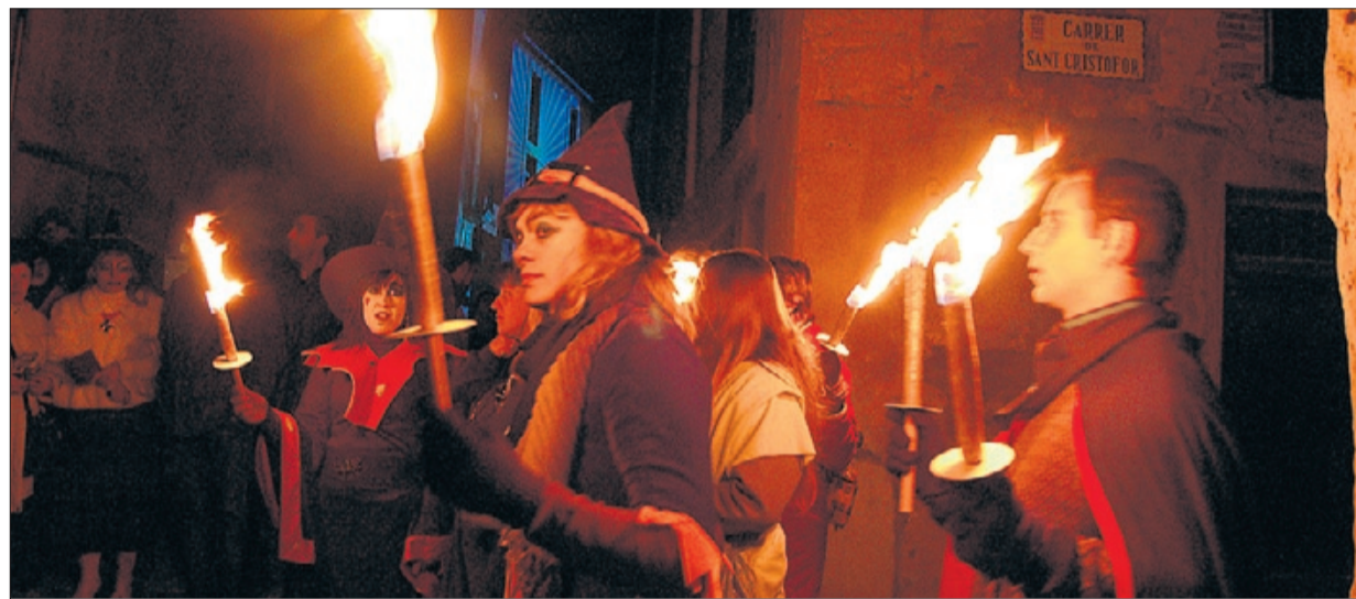
▶▶ Un moment de l'espectacle 'El misteri de Centelles' en l'última edició de la festa de Centelles.